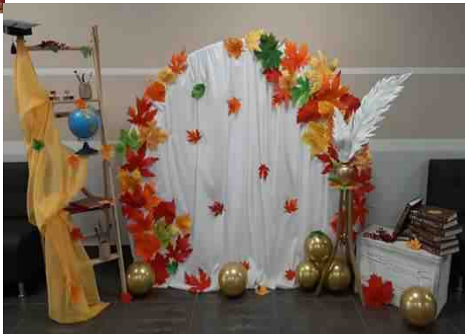
Фотозона ко дню Учителя