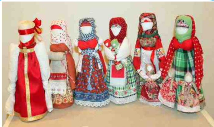
Мастер-класс по рукоделию «Народная тряпичная кукла – закрутка»