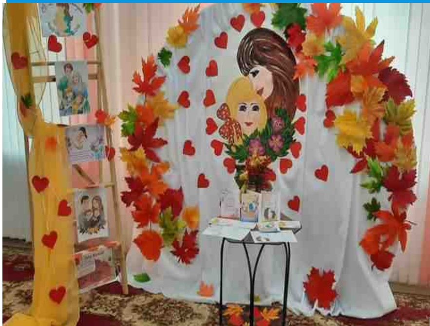
Фотозона ко дню Матери